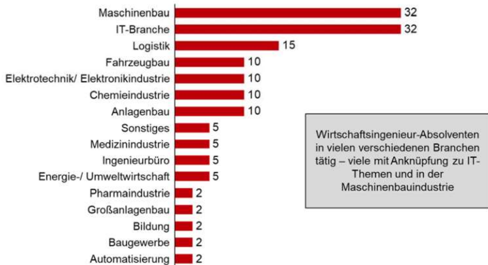
Abbildung 3: Branchenzugehörigkeit der Unternehmen der Absolventen (n=44), Umfrage im Mai 2019.

In welcher Branche sind Sie, nach Abschluss Ihres Studiums, hauptsächlich tätig? (Mehrfachnennungen möglich)?, BA und Dipl. WIng n = 41, in % der Befragten