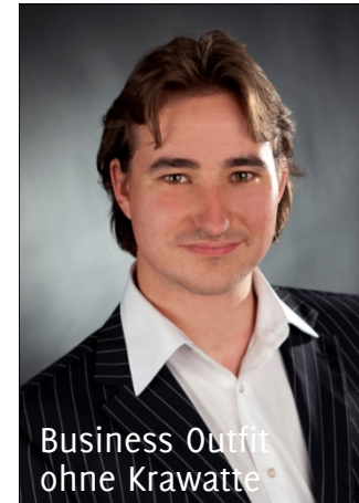
Business Outfit ohne Krawatte