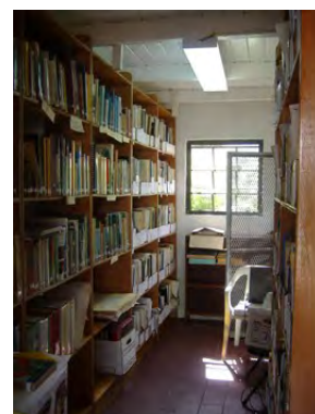
Archive and Library of the National Trust Montserrat Erste Hilfe für die Archivalien nach einem Vulkanausbruch und Arbeiten in einer provisorischen Restaurierungswerkstatt