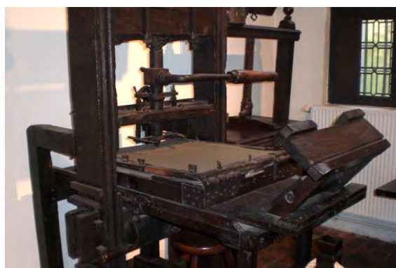
Plantin-Moretus-Museum Führung durch das Druckerei- und Verlagshaus