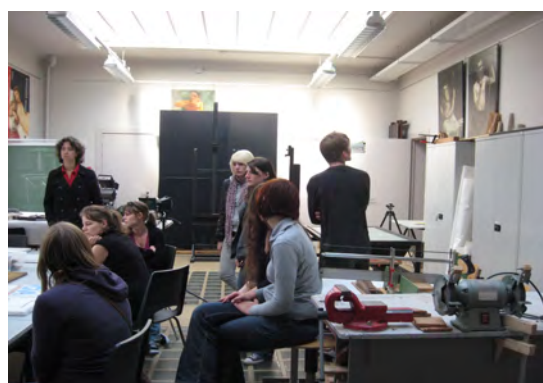
Königliche Akademie der Schönen Künste Besuch der Restaurierungsabteilungen