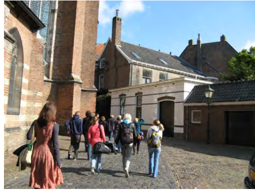
Walpurgiskerk Führung durch die Kettenbuchbibliothek