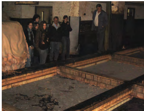
Lederfabrik und Ledermuseum Besuch einer traditionell arbeitenden Vegetabilgerberei