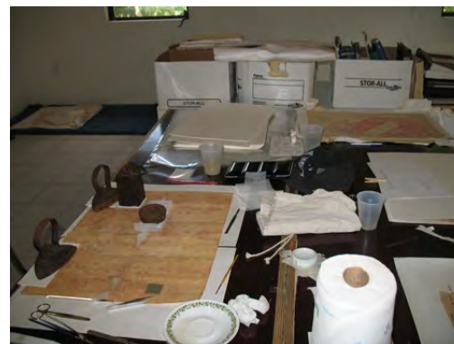
Restaurierungs- und Konservierungsmaßnahmen an Archivalien und Büchern