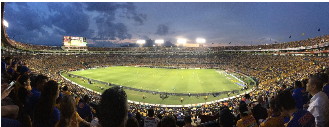
Abbildung 4: Estadio Universitario (UANL)

Wenn ihr euch für Fußball interessiert, habt ihr es nicht weit zu den besten Teams im Land. Das Stadion von CF Monterrey ist direkt in Sichtweite von der Tec. Dieses ist erst kürzlich gebaut worden und bietet einen spektakulären Blick auf den Cerro de la Silla. Wir waren lediglich bei einem Spiel von Tigres UANL, welche auf dem Gelände der dazugehörigen Universität ihre Heimspiele austragen. Ihr Stadion verspricht mehr Lateinamerika-Flair und ist ein Besuch wert.