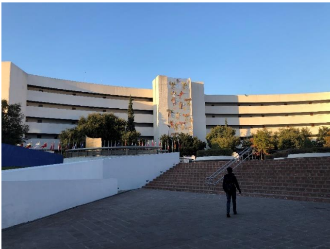
Abbildung 3: Campus

an der Tec einen Kurs tatsächlich nicht zu bestehen. Aber wo es Negativbeispiele gibt, findet man natürlich auch Leute die ebenso motiviert ihren Aufgaben nachgehen. In diesem Fall macht es dann auch Spaß, an einer gemeinsamen Sache zu arbeiten. Im Allgemeinen kann man seine Noten schon aufbessern, dafür ist es jedoch essentiell eine gute Organisation zu haben. Bei den ganzen Abgaben und aufgrund der Tatsache, dass man sich auf seine Kommilitonen nicht immer verlassen kann, muss man immer den Überblick haben. Eine Sache, die ich positiv hervorheben möchte, ist die hohe Praxisorientierung der Kurse. Ich hatte über das Semester zwei Kurse, in denen ein Praxisprojekt bei einem lokalen Unternehmen durchgeführt werden musste. Dies hat mir sehr gut gefallen, auch durch die Einblicke, wie es in Unternehmen in Mexiko läuft. Auch die Tatsache, dass man meistens nicht in einer klassischen Frontalvorlesung sitzt, sondern immer wieder mitarbeiten muss, macht es interessant, da man aktiv mitdenken muss.