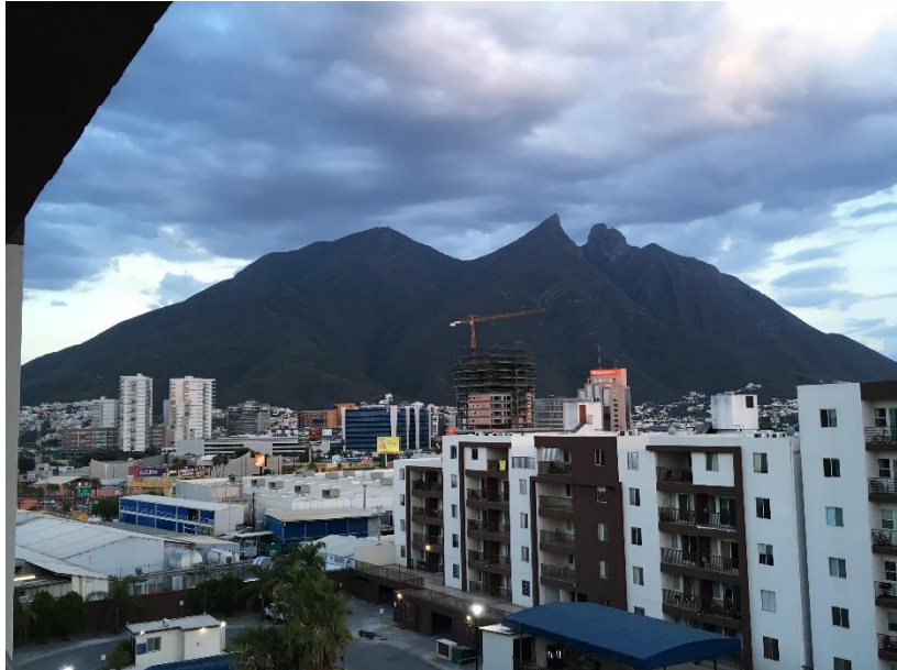
Abbildung 1: Ausblick aus meinem Appartement auf den Cerro de la Silla

Allgemein kann man dies entweder auf eigene Faust regeln oder über Organisationen wie z.B. ISE, welche Freizeitangebote und Wohnungsvermittlungen für Austauschstudenten anbieten. Da es als „Ausländer“ relativ schwierig war ein Appartement zu finden, erst recht nur übers Internet, nutzte ich das Angebot von ISE. Diese vermittelten mir ein Appartement im VillasTec, eine Art privates Wohnheim, welches per Fuß etwa zehn Minuten zum Hauptcampus der Tec entfernt ist. Alles in allem war ich mit diesem Service recht zufrieden. Allerdings kann ich diese Organisation nur eingeschränkt empfehlen, da ich Schwierigkeiten hatte, bei Abreise meine Kautionswiederzubekommen. Gleiches gilt für die Partys und Touren, die sie anbieten. Dort dreht sich nahezu alles um sehr ausgiebigen Alkoholkonsum. Auf der anderen Seite kann man auf diese Weise viele andere Austauschstudenten kennenlernen.