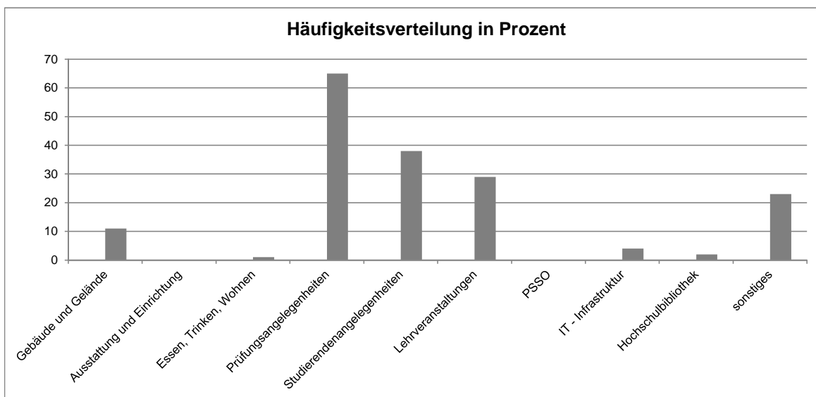
Häufigkeitsverteilung in Prozent