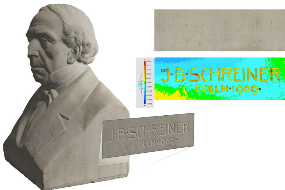
Abb. 2 Verdeutlichung der Inschrift durch geometrische Modifikation und Simulation von Streiflicht sowie als Falschfarbenmodell im Vergleich zu einer ebenen Fläche. Johann Baptist Schreiners Büste von G. L. Camphausen, Marmor (Köln, 1909).

Digitale Methoden bieten ein breites Spektrum an Möglichkeiten, die Merkmale der Spuren zu visualisieren . Repräsentationsformen wie Höhenlinienmodelle, Falschfarbendarstellungen und virtuelle Negativformen ermöglichen eine umfassende und genaue Analyse der Spuren. Virtuelle Quer- und Längsschnittanalysen zeigen deutlich Tiefen- und Komplexitätsmerkmale, die bei den traditionellen Methoden nicht darstellbar sind (Abb. 3)(Levoy 2004, 32-34, Trefný et al. 2022; Cihla et al. 2022b; Hodač et al. 2023).