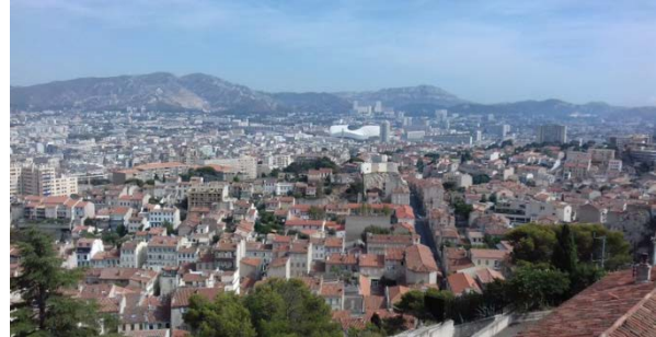
Blick von Notre Dame de la Garde auf Mar

Zu Beginn meines Aufenthalts fand ein 1-wöchiger Französischkurs statt, welcher am Campus gegenüber des Bahnhofs angeboten wurde. Nachmittags konnte man dann mit den anderen Erasmus-Studenten an einer organisierten Tour teilnehmen, die einem die Stadt, die Calanques (Naturschutzgebiet am Meer), Aix-en-Provence (Stadt 30 Minuten von Marseille) und die Umgebung näherbrachte. Hierbei konnte man bereits erste Kontakte knüpfen. Nach dieser Woche begann dann der Unterricht. Ich hatte mich im Studiengang „Génie Industriel“ (Wirtschaftsingenieurwesen) eingeschrieben.