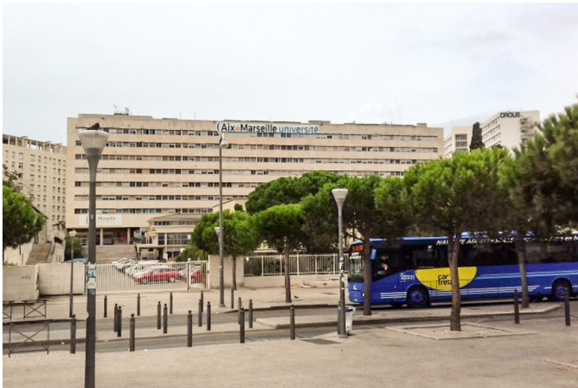
Hauptcampus gegenüber des Bahnhofs Saint