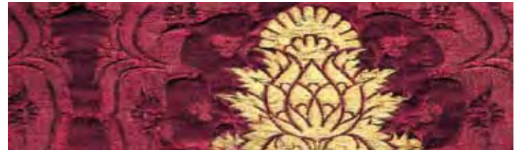
Textil und archäolo- gischen Fasern