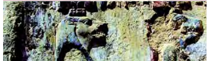
Wandmalereien und Objekten aus Stein