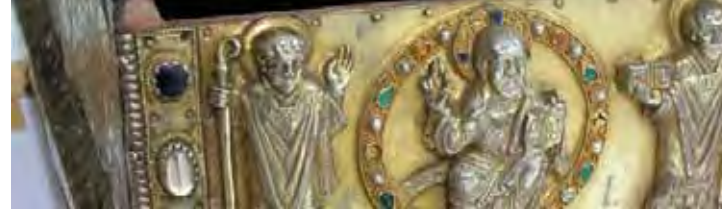
Gemälden und Skulpturen