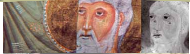
Schriftgut, Grafik und Buchmalerei