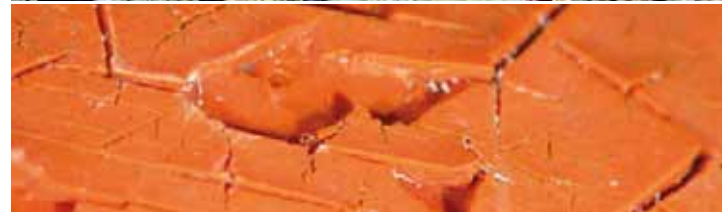
Objekte aus Holz und Werkstoffe der Moderne