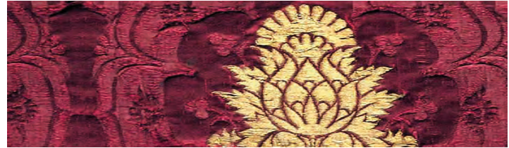
Textil und archäolo- gischen Fasern