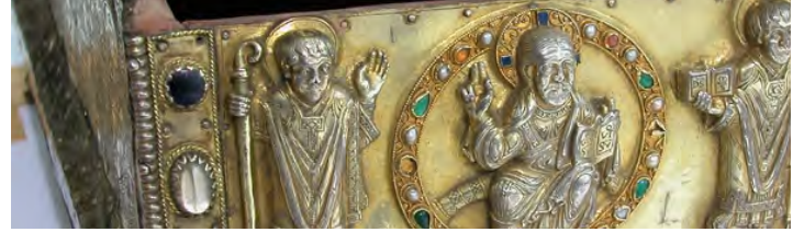
Gemälden und Skulpturen