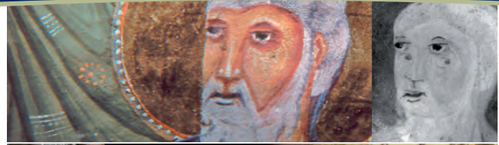
Schriftgut, Grafik und Buchmalerei