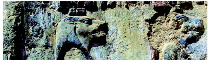
Wandmalereien und Objekten aus Stein