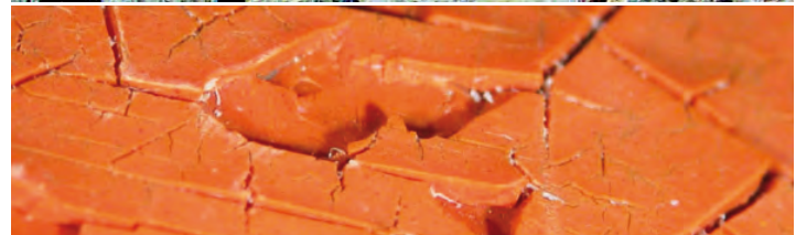
Objekten aus Holz und Werkstoffe der Moderne