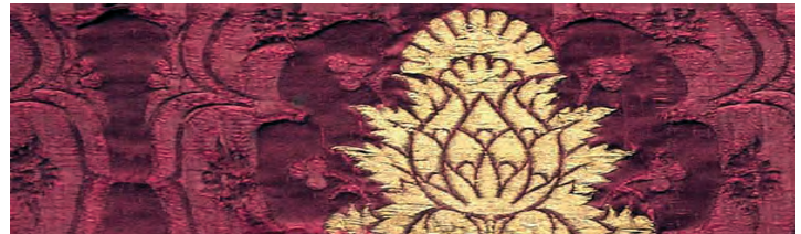
Textil und archäolo- gischen Fasern