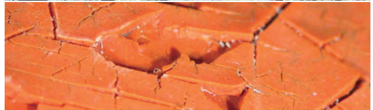
Objekten aus Holz und Werkstoffe der Moderne