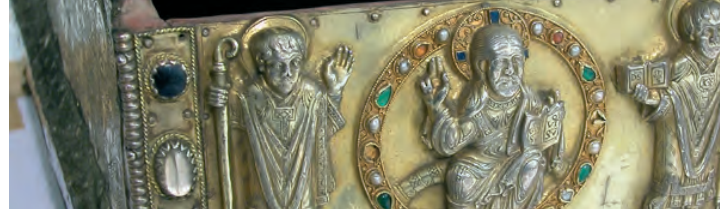
Gemälden und Skulpturen