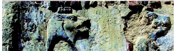
Wandmalereien und Objekten aus Stein