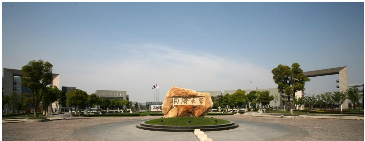
Jia Ding, Shanghai – Eingang des Jia Ding Campus