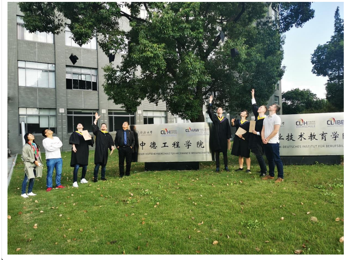
Jia Ding Campus, Shanghai – Abschlussfeier der Verbliebenen