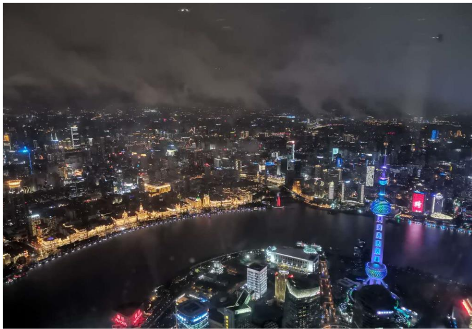
Pudong, Shanghai – Aussicht Shanghai Tower