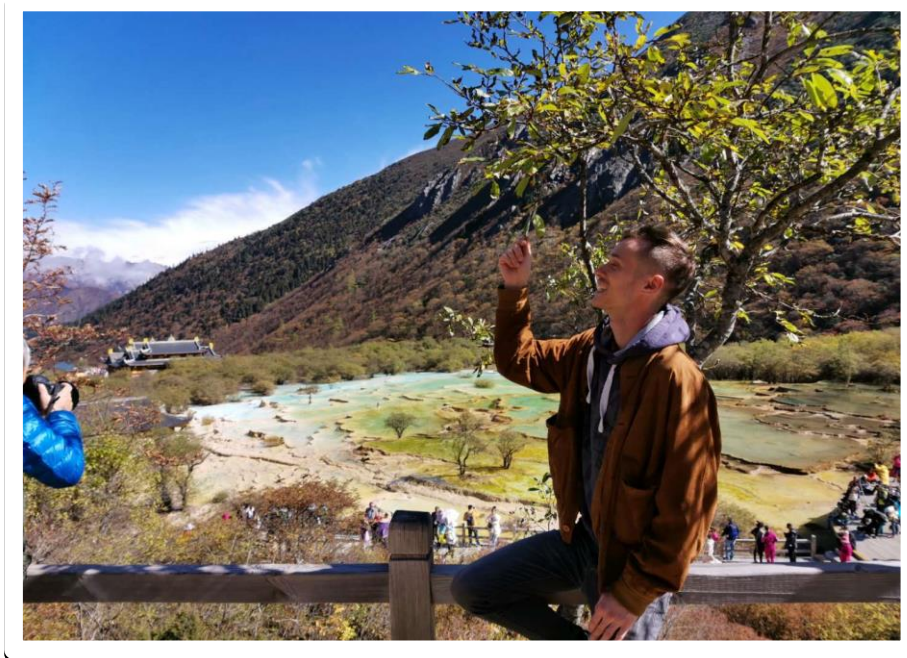
Aba, Sichuan – 4.000 Meter Höhe

Im Rahmen dieses Erfahrungsberichtes möchte ich kurz und knapp den Ablauf des Doppelabschlussprogramms an der Tongji Universität zusammenfassen und meine wichtigsten Erfahrungen, die ich während meiner Teilnahme machen durfte, mit anderen chinainteressierten Studenten teilen. Eine gute Nachricht für alle die sich auf diese einzigartige Chance bewerben möchten, ist das sich sehr wenige Studenten von der TH Köln und anderer Universitäten Deutschlands auf dieses Programm bewerben. Die Chancen für eine erfolgreiche Annahme stehen also relativ gut. Für diejenigen, die sich die Teilnahme aus welchen Gründen auch immer nicht zutrauen, kann ich sagen, dass mit dem korrekten Ausfüllen und Einreichen der formalen Dokumente der schwierigste Schritt zur Reise nach China erledigt ist, danach ergibt sich schon alles irgendwie. Achtung, es folgen ein paar Urlaubsfotos :-)