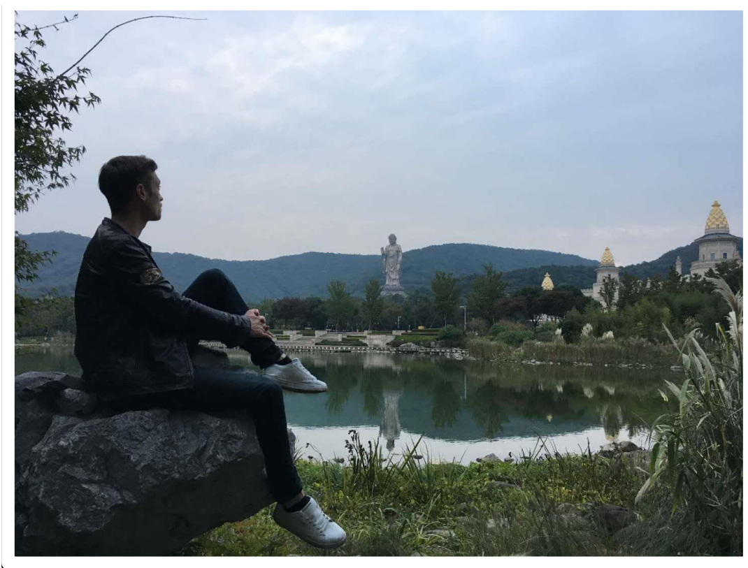
Wuxi, Jiangsu – Big Buddha Aussicht

Abschließend möchte ich mich herzlich bei meinen Professoren, Dozenten und dem Förderverein Gummersbach bedanken, die mich bei meinem Vorhaben unterstützt haben. Wie bereits in der Einleitung erwähnt stehe ich chinainteressierten Studenten über den unten stehendem Kontakt zur Verfügung. Ich plane auch eine Informationsveranstaltung, in der ich gerne einen detaillierteren Einblick zum Chinaaustausch geben und persönliche Fragen beantworten möchte. Haltet euch am besten beim International Office dazu informiert. Bis Bald :-)